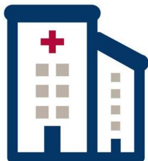
Vård på akuten