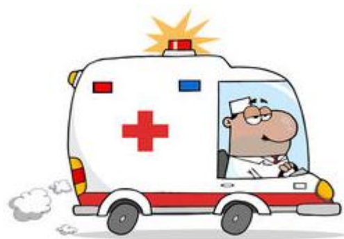
Vård i ambulans

Uppnå kostnadsbesparing genom att en och samma artikel används genom hela vårdprocessen.